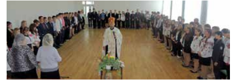
Посвята в ліцеїсти